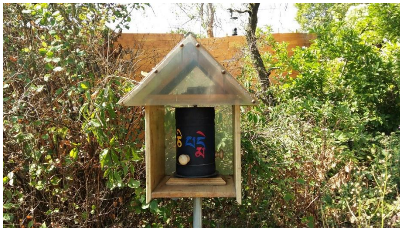
Mögen alle Wesen gesund und glücklich sein!